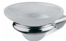
ACCDXV30006CR Porta spazzolini vetro satinato sospeso Wall mounted Glazed Glass Toothbrush Holder