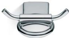
ACCDXV30002CR Supporto porta accappatoio Robe Hook