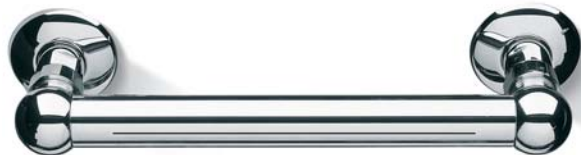
SOFDX009CR Soffione orizzontale cascata "Water Fall" horizontal Head Shower