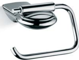
ACCDXV30008CR Porta rotolo Toilet Roll Holder