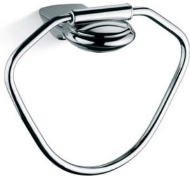
ACCDXV30001CR Anello porta asciugamano Towel Ring