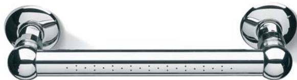
SOFDX011CR Soffione orizzontale Full Spray Full spray horizontal Head Shower