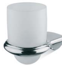
ACCDXV30003CR Porta sapone vetro satinato sospeso Wall mounted Glazed Glass Soap Dish