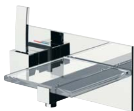
RUBDXV09L9CR Miscelatore lavabo incasso Concealed basin single lever mixer

raffinate trasparenze / refined transparency