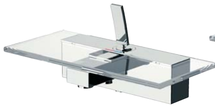
RUBDXV09V0CR Miscelatore vasca esterno Bath single lever mixer