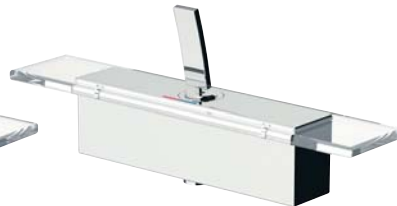
RUBDXV09E0CR Miscelatore doccia esterno Exposed shower mixer