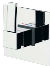
RUBDXV09I2CR Miscelatore doccia incasso Concealed shower mixer