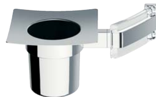
ACCDXV90006CR Porta spazzolini sospeso Wall mounted Toothbrush Holder