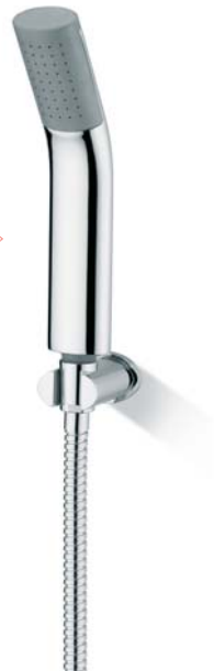
SERDX72501CR Kit duplex fissa doccia full spray Senso Senso full spray shower duplex kit