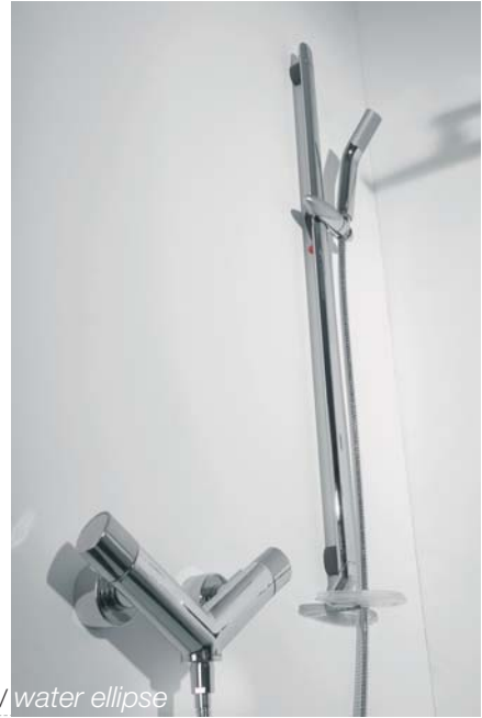
ellissi d'acqua / water ellipse