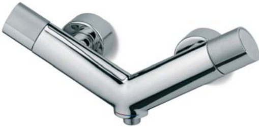
RUBDXV01E0CR Gruppo doccia esterno Exposed shower mixer