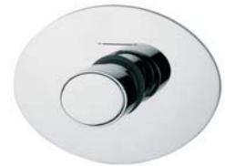
RUBDXV01I1CR Rubinetto di arresto incasso Concealed faucet