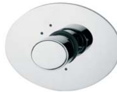
VALDXV16CR Deviatore 5 vie incasso 5 way concealed ceramic diverter