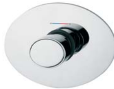
RUBDXV01I0CR Miscelatore doccia incasso progressivo Concealed shower progressive lever mixer