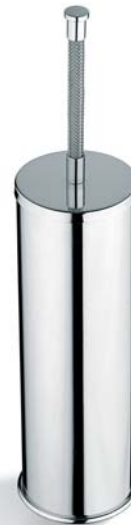
ACCDXV40007CR Porta scopino wc appoggio Free Standing Toilet Brush & Brass Holder