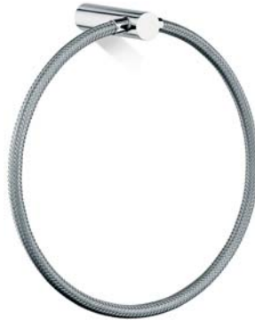
ACCDXV40001CR Anello porta asciugamano Towel Ring