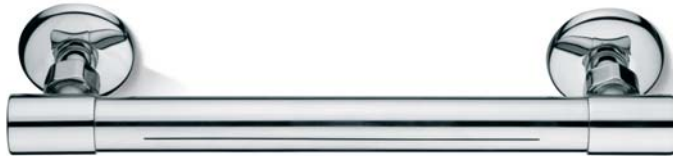
SOFDX039CR Soffione orizzontale cascata Water fall horizontal head shower