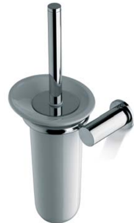
ACCDXV50007CR Porta scopino wc ceramica sospeso Wall mounted Toilet Brush & Ceramic Holder