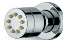
SOF84CR Soffioncino Body Spray Style Style adjustable body spray