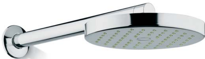
SOFDX109CR + BRADX003CR Soffione Ø 200 mm + braccio a parete lungh. 370 mm Head Shower Ø 200mm + Wall arm 370mm lenght head