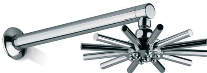
SOFDX014CR + BRADX003CR Soffione "Stella" Ø 230 mm + braccio a parete lungh. 370 mm "Star" Head Shower Ø 230mm + Wall arm 370mm length