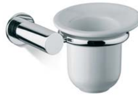
ACCDXV50003CR Porta sapone ceramica sospeso Wall mounted ceramic Soap Dish