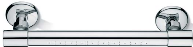
SOFDX040CR Soffione orizzontale Full Spray Full spray horizontal head shower